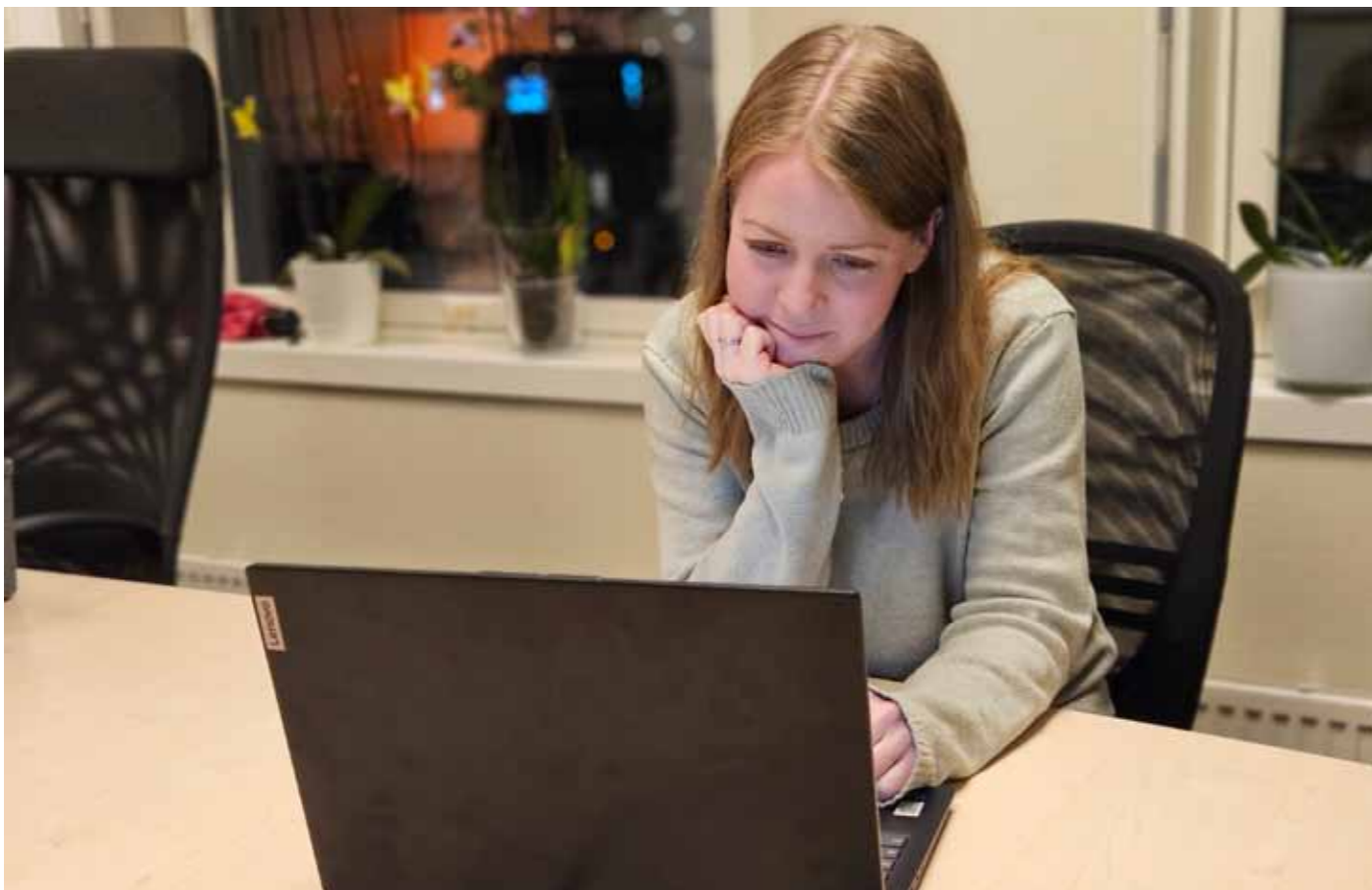
Pia på chat: Jeg kjenner på dyp takknemlighet og ydmykhet overfor de utrolig modige menneskene som kontakter oss.