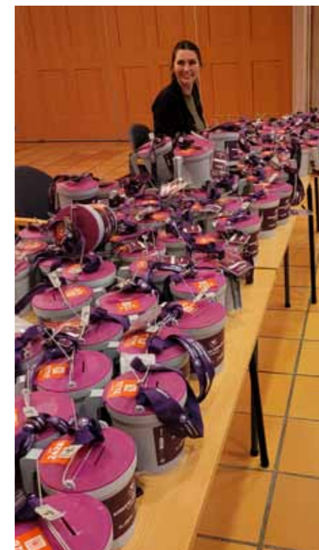
Bilde til høgre: Janne Eide gjer klar bøsseane til årets fasteaksjon. I Nedstrand og Skjoldastraumen er aksjonsdagen søndag 6. april. Resten av konfirmantane i Tysvær og Bokn går rundt med innsamlingsbøsser tirsdag 8. april.