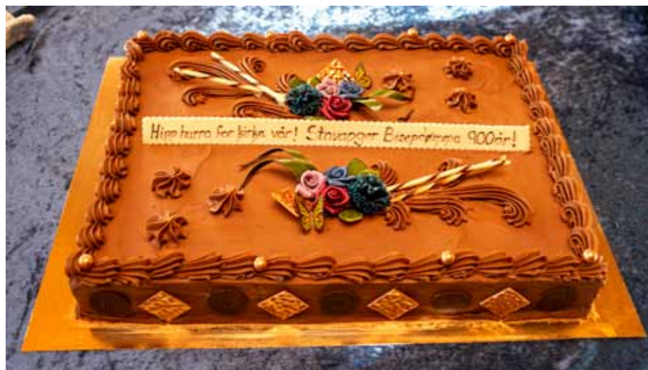
Den store jubileumskaka.

Tysværtunet var åpent, og på biblioteket kunne en få med seg en utstilling om Stavanger i 900 år. På kinoen viste de en Kaptein Sabeltann film. Og de som ville, kunne ta seg en dukkert i badeanlegget.