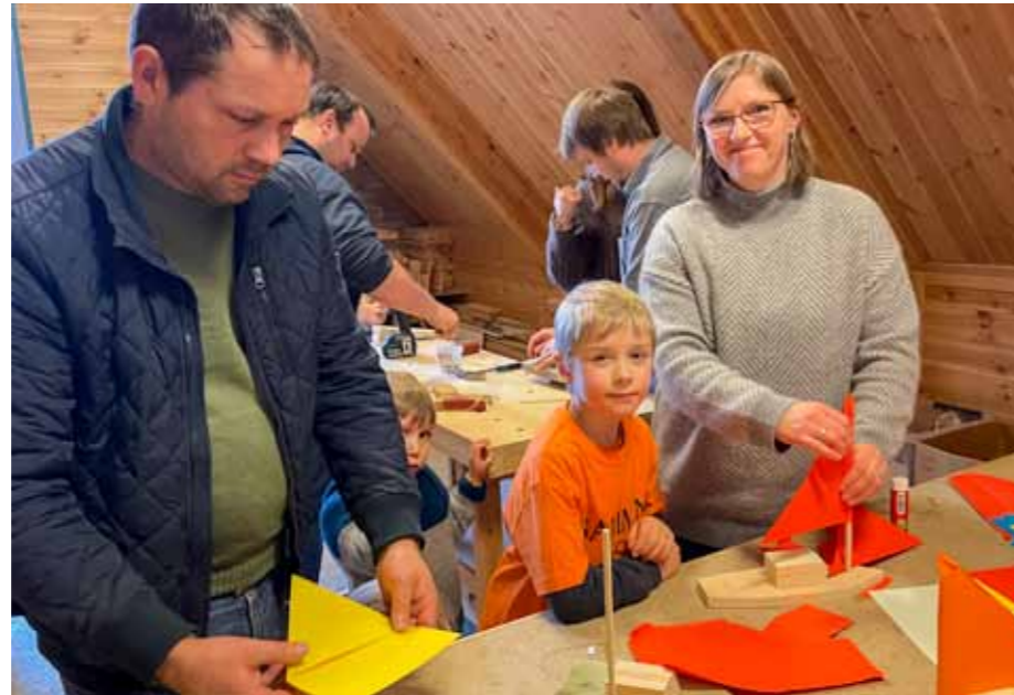
Ivrige båtbyggere.

– De øvde inn en bursdagssang og 2 nylagede jubileumssanger som koret framførte på