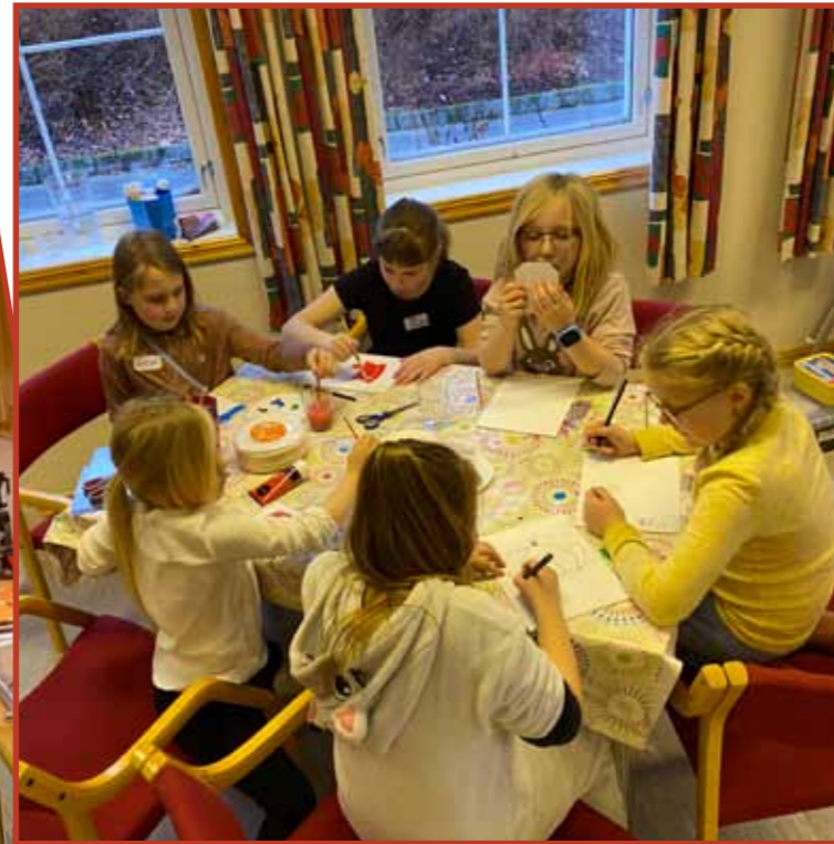
20. januar var det Diakonidag for tredjeklassingar på Tysvær soknehus. Bileta er frå nokre av dagens aktivitetar.