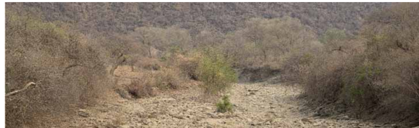
Det har vore tørke i Zambia og store delar av det sørlege Afrika sidan starten av 2024. Her ei uttørka elv i Gwembe.

Ei solcelledriven vasspumpe pumpar vatn frå eit borehol opp til to store vasstankar. Derfrå blir vatnet ført ut gjennom slangar med små hol,